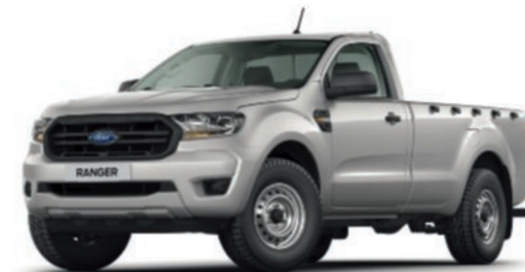
RANGER SINGLE CAB