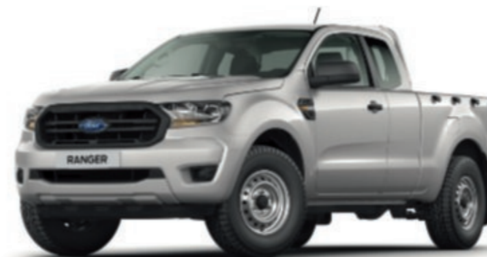
RANGER SUPER CAB