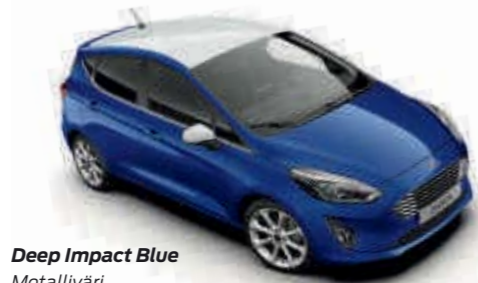
Deep Impact Blue Metalliväri