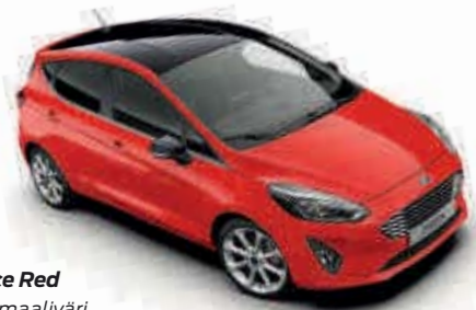
Race Red Normaaliväri