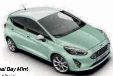
Bohai Bay Mint Metalliväri