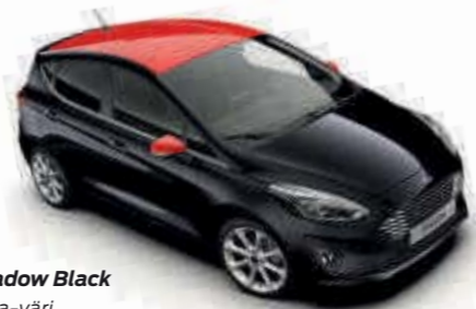
Shadow Black Mica-väri