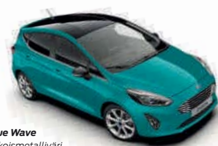
Blue Wave Erikoismetalliväri