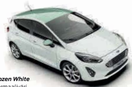
Frozen White Normaaliväri