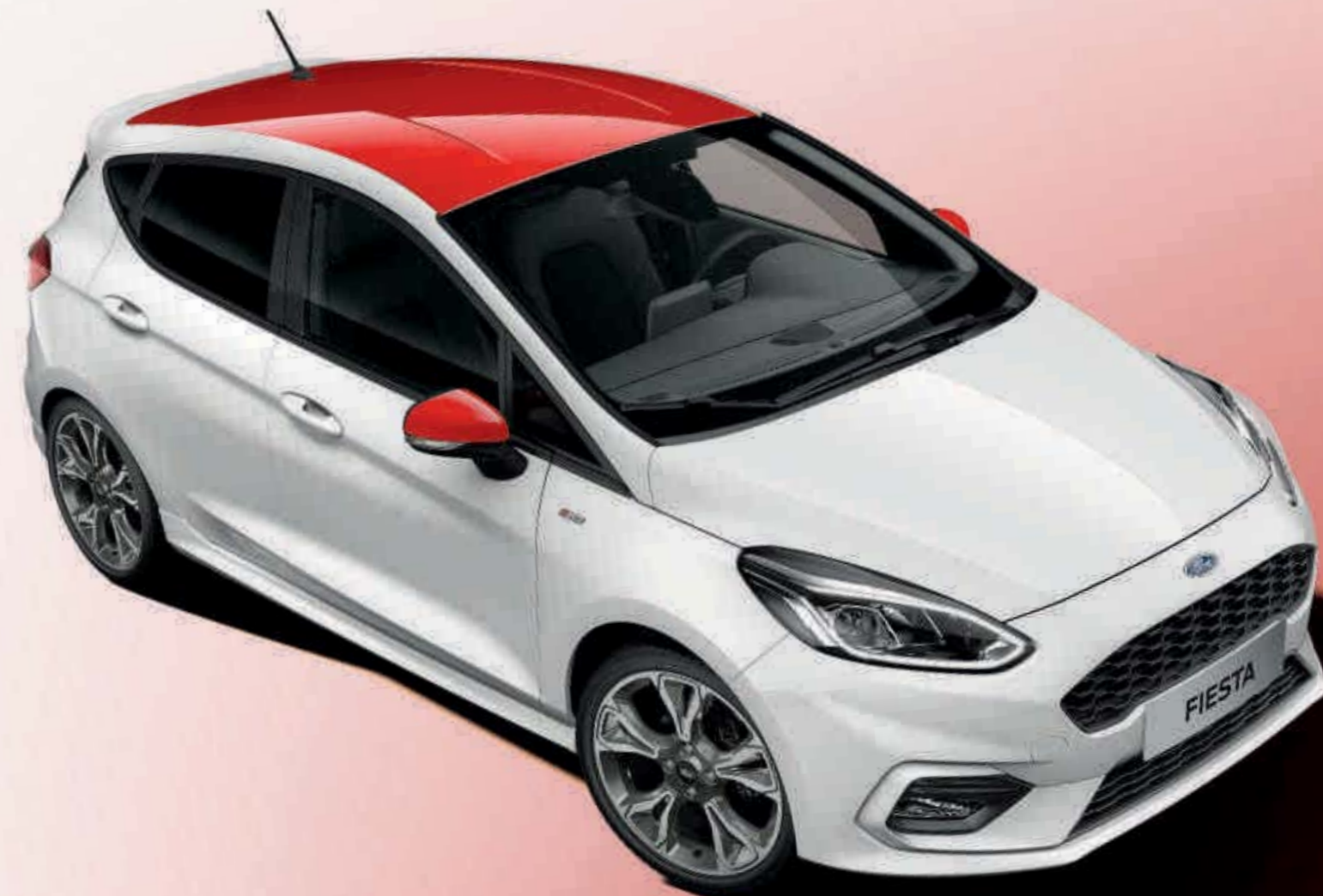
Ford Fiesta ST-Line, jossa on valinnaisvarusteena koriväri Frozen White, korin Race Red -yksilöintipaketti ja kiillotetut 18" Rock Metallic -kevytmetallivanteet.

Huom: Ford Fiestaan saatavat 18" vanteet ja renkaat on suunniteltu antamaan urheilullisemmat ajo-ominaisuudet ja jäkämmän ajotuntuman kuin 15" ja 16" vakiovanteet ja renkaat. Kaikki 17" ja 18" vanteet edellyttävät ohjauksen hammastangon liikerajoitinta (tehdas- ja jälleenmyyjäasennus).