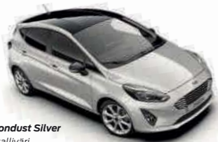
Moondust Silver Metalliväri