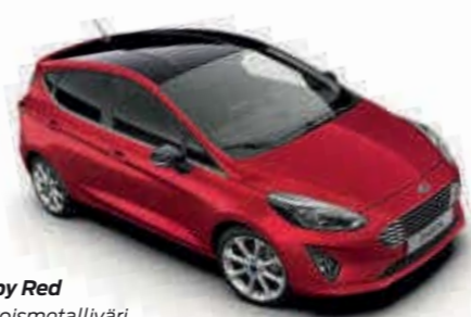
Ruby Red Erikoismetalliväri