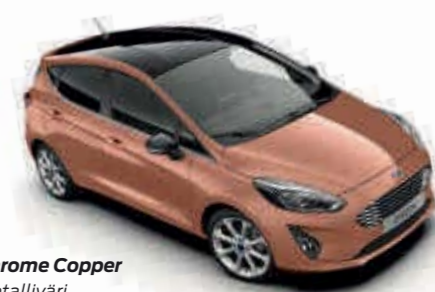
Chrome Copper Metalliväri