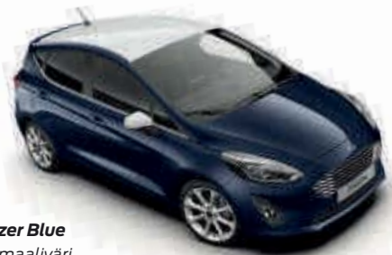
Blazer Blue Normaaliväri